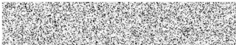
starosta Města Čáslav