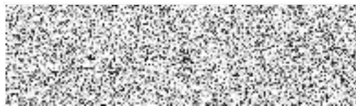
starostka obce Drobovice