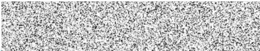
Ing. Jaromír Strnad starosta města

Zastupitelstvo města Čáslavi schvaluje uzavření Veřejnoprávní smlouvy o zabezpečení místních záležitostí veřejného pořádku Městskou policií Čáslav mezi městem Čáslav a obcí Drobovice, IČ: 00640204 se sídlem Drobovice 64, PSČ 286 01.