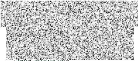
Jana Skotnicová pověřená vedením odboru

Písemnost Čj. MěÚ/19933/2017/ŽP, SZ 2890/2017-pilc, Poskytnutí informací podle zák. č. 106/1999 Sb. vypravená 07.08.2017 11:32:15 do datové schránky (ID datové zprávy 492792919) byla 09.08.2017 21:45:13 doručena.