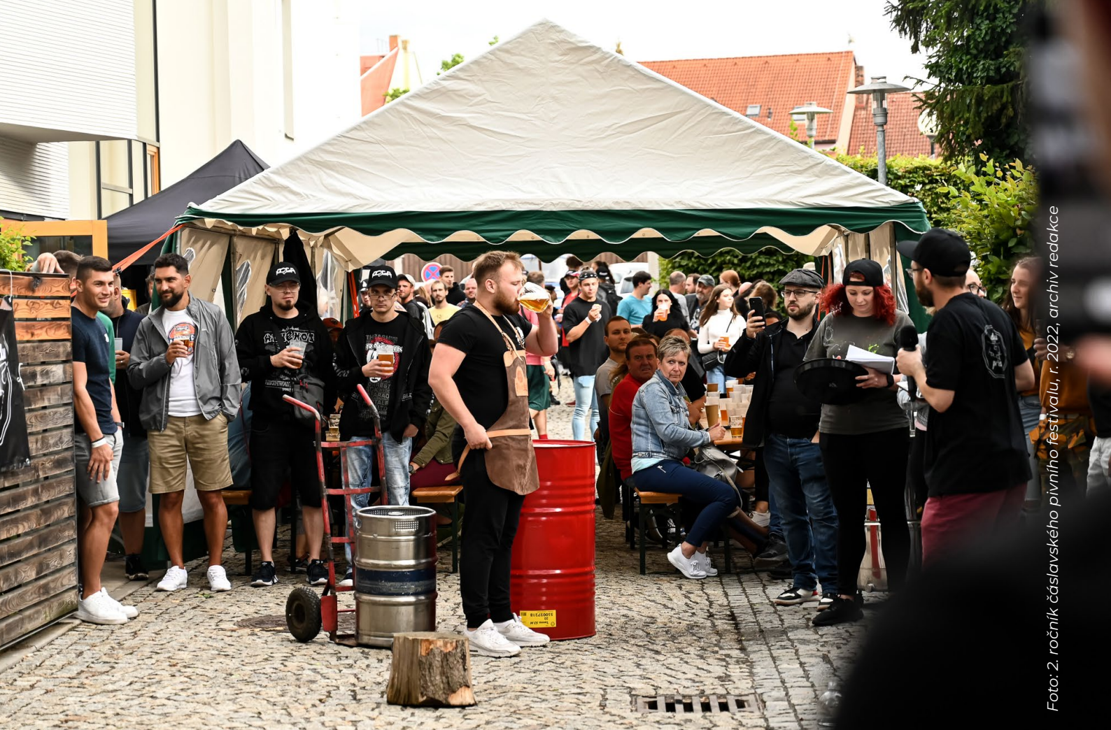
Foto: 2. ročník čáslavského pivního festivalu, r. 2022, archiv redakce