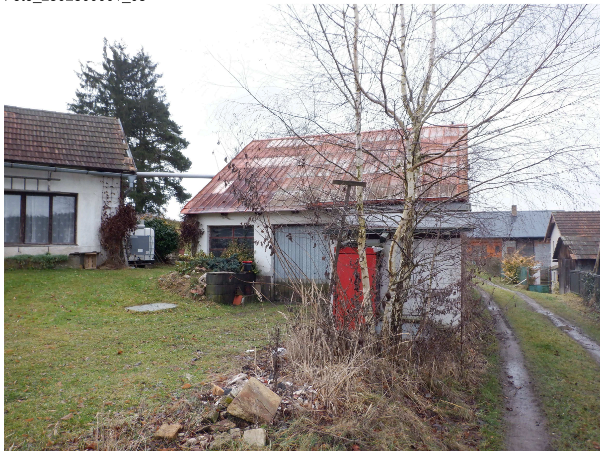
Zdroj: Znalecký posudek č. 5275-7/2023