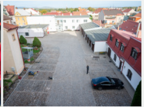
Komunikaci ve dvoře radnice zdobí nový povrch, pod kterým se skrývají retenční nádrže.