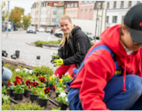
S podzimní výsadbou v parku J. Žižky městské zahradníci pomohli žáci SZeŠ Čáslav.