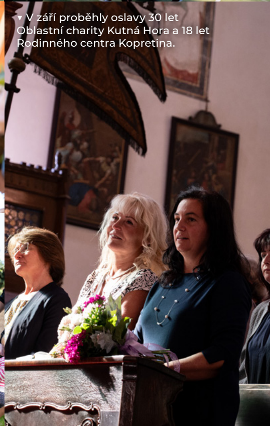
▼ V září proběhly oslavy 30 let Oblastní charity Kutná Hora a 18 let Rodinného centra Kopretina.