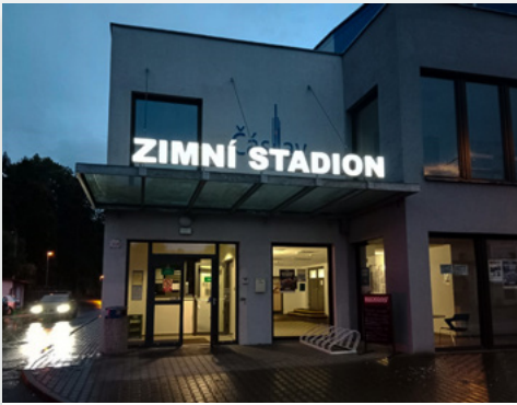
Zimní stadion, který v prosinci oslaví osmé narozeniny, zdobí nové označení.